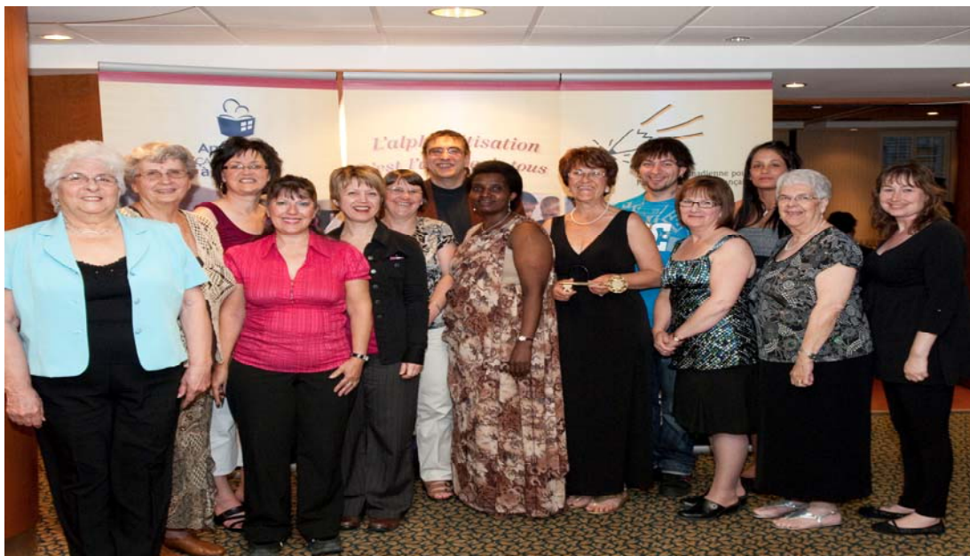
Groupes de personnes apprenantes participant au Forum 2009

Il se peut que suite à la consultation nationale, le modèle de gouvernance soit différent de celui qu'on connaît. Le RPPA aura peut-être lui aussi des ajustements à apporter à son fonctionnement. Pour l'instant, le Réseau doit se pencher sur différents aspects afin de mieux accomplir son rôle. Une réflexion sur la consolidation du Réseau permanent des personnes apprenantes doit se poursuivre. Une telle réflexion est prévue lors du Forum 2010.