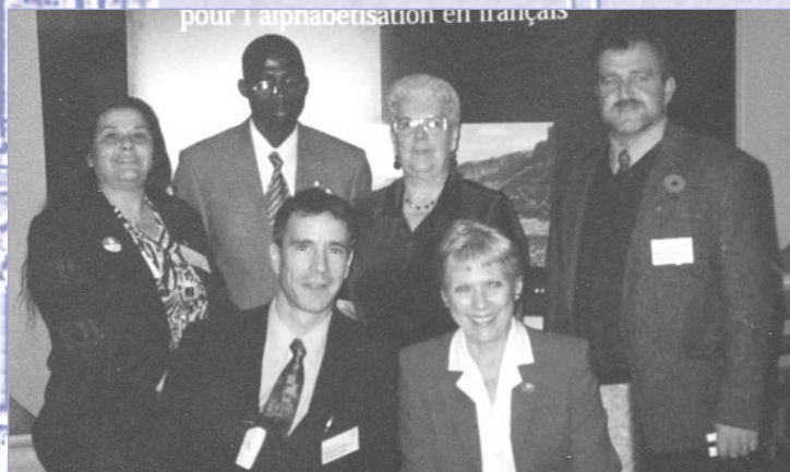
Les membres du comité des apprenants en compagnie de la sénatrice Joyce Fairbairn

• « Nous avons besoin d'un plan d'action pour l'alphabétisation. Vous pouvez nous aider en tant que parlementaires en écrivant une lettre d'appui à notre demande à la ministre Jane Stewart. »